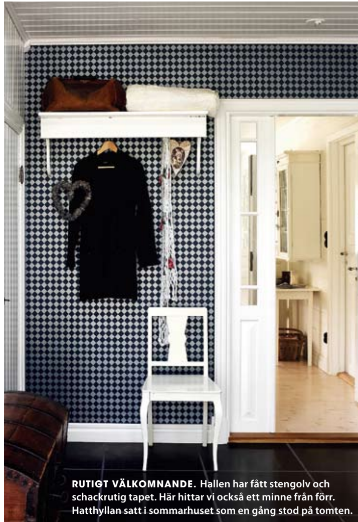
RUTIGT VÄLKOMNANDE. Hallen har fått stengolv och schackrutig tapet. Här hittar vi också ett minne från förr. Hatthyllan satt i sommarhuset som en gång stod på tomten.