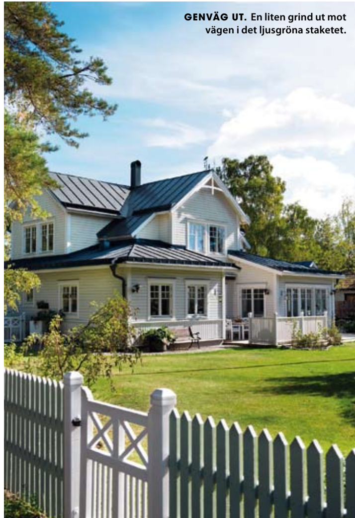
GENVÄG UT. En liten grind ut mot vägen i det ljusgröna staketet.