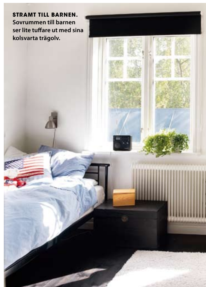
STRAMT TILL BARNEN. Sovrummen till barnen ser lite tuffare ut med sina kolsvarta trägol.

”Att hänga upp gardiner vore att slösa bort det fina ljuset”