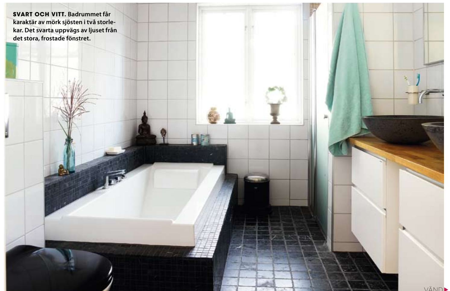
SVART OCH VITT. Badrummet får karaktär av mörk sjösten i två storle- kar. Det svarta uppvägs av ljuset från det stora, fröstade fönstret.