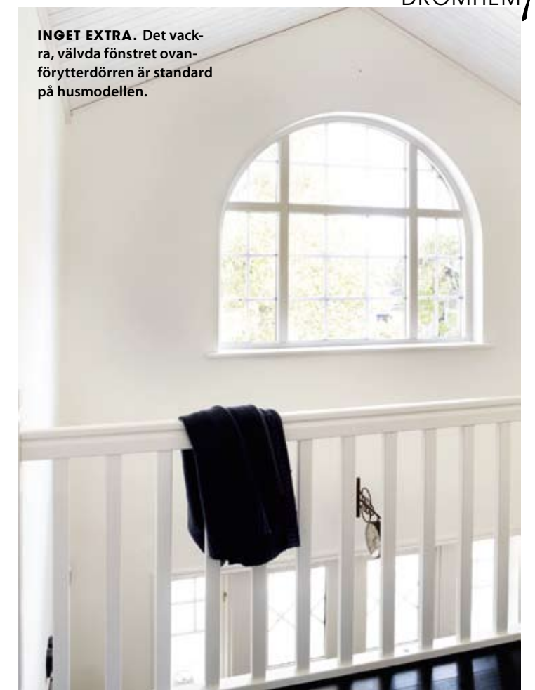
INGET EXTRA. Det vack- ra, välvda fönstret ovan- för ytterdörren är standard på husmodellen.