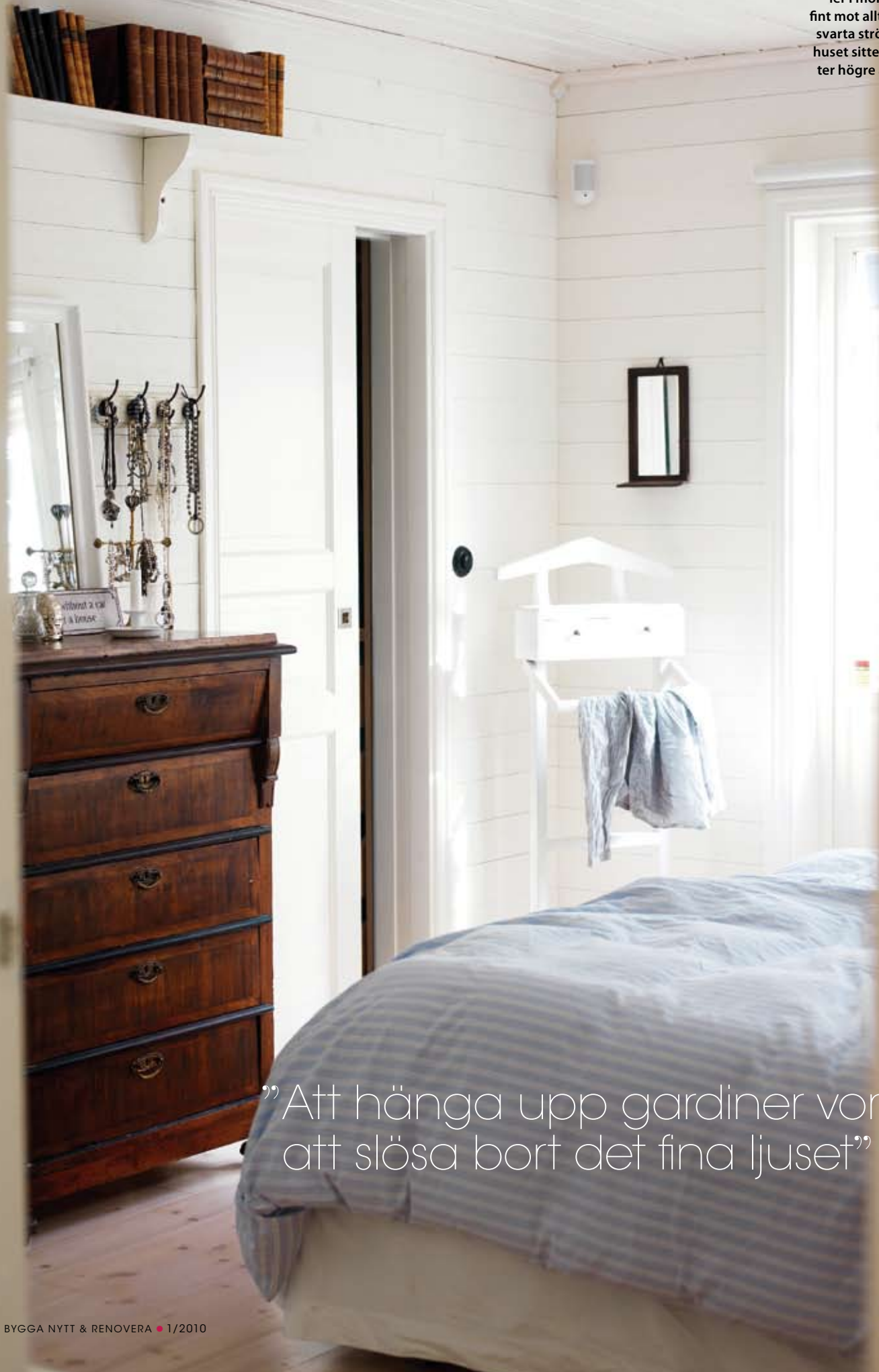
SOVRUM I VITT. Möb- ler i mörkt trä bryter fint mot allt det vita. De svarta strömbrytarna i huset sitter en decime- ter högre än standard.

”Att hänga upp gardiner vore att slösa bort det fina ljuset”